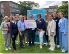
Gruppenbild mit Minister Philipp und BerNi-Team